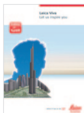
Leica Viva Broszura ogólna

Ilustracje, opisy i dane techniczne nie są wiążące. Wszystkie prawa zastrzeżone. Drukowano w Polsce - Copyright Leica Geosystems AG, Heerbrugg, Szwajcaria, 2010. 782624pl - IX.10 - RDV