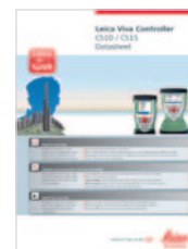
Leica Viva Controller CS10 / CS15 Dane techniczne