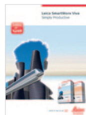
Leica SmartWorx Viva Broszura produktu