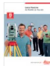
Leica Flexline Broszura ogólna