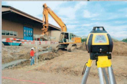
Niwelator laserowy Leica Rugby 50

W promocji dostępne są lasery obrotowe RUGBY (modele Rugby 50, 55, 100, 100LR, 260SG, 270SG, 280DG, 320SG, 410DG, 420DG) i lasery rurowe PIPER (modele Piper 100, Piper 200)