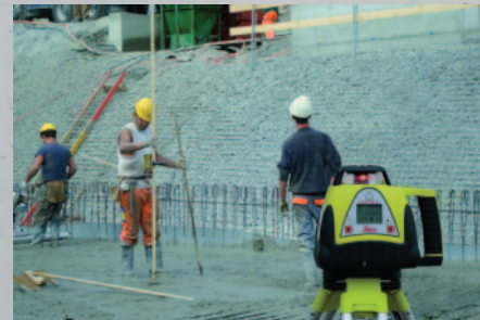
Niwelator laserowy Leica Rugby 280

Specjalna oferta ważna do 31.12.2011 r. wyłącznie u autoryzowanych dystrybutorów Leica Geosystems. Wybierz swoje województwo, zadzwoń i dowiedz się więcej.